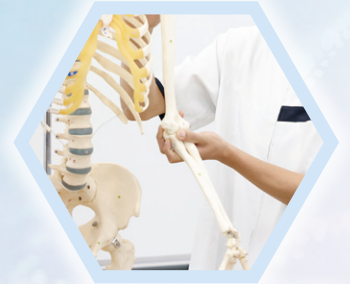
リハビリテーション学領域